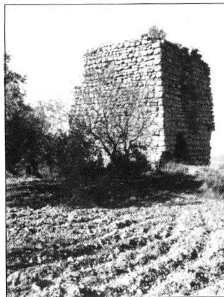
TORRE DE LA PLATA